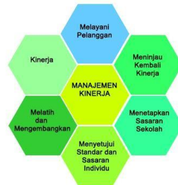
Gambar 10.3. Lingkaran Manajemen Kinerja yang Baik dan Profesional

Berikut ini gambar lingkaran manajemen kinerja yang baik dan profesional Gambar 3 Lingkaran Manajemen Kinerja