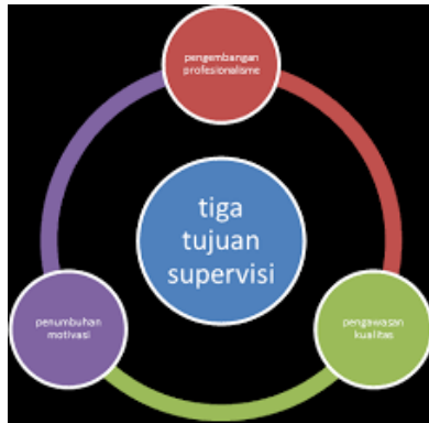
Gambar 7.1 Tujuan Supervisi Pendidikan

Pertama, mengembangkan profesionalisme, supervisi bertujuan mendukung guru dalam pengembangan profesionalisme supaya seorang guru yang handal dan dapat dipercaya, sehingga sanggup meningkatkan kualitas mengajar menjadi lebih baik. Hal ini sebagaimana disebutkan dalam surah al Qashash:26