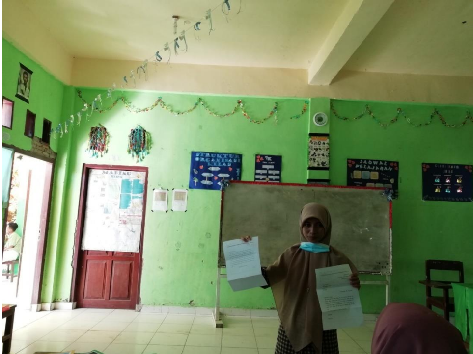
(The Process of explaining about personal letter)