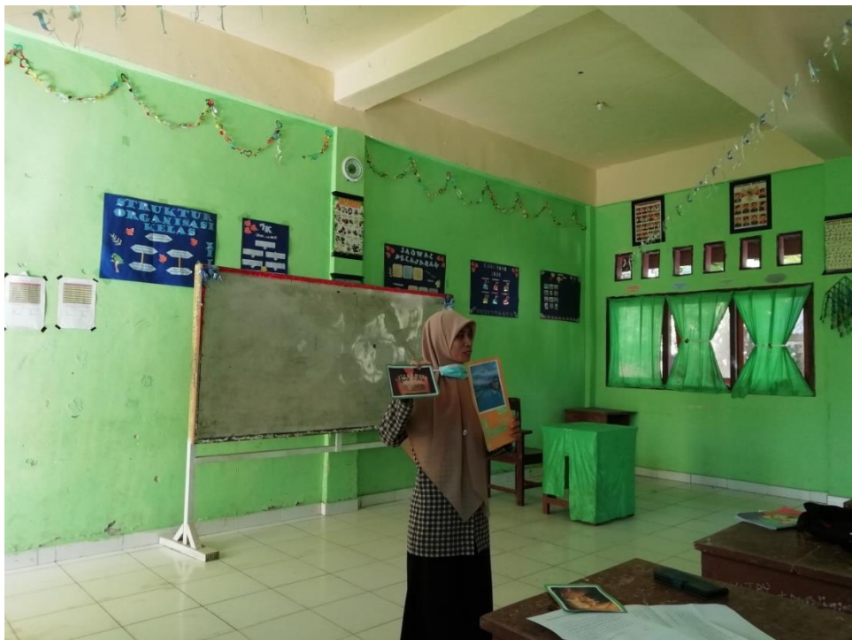
(The Process of explaining about descriptive text)