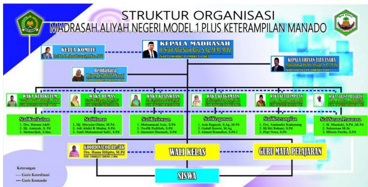
Gambar 4. 1 Struktur Organisasi